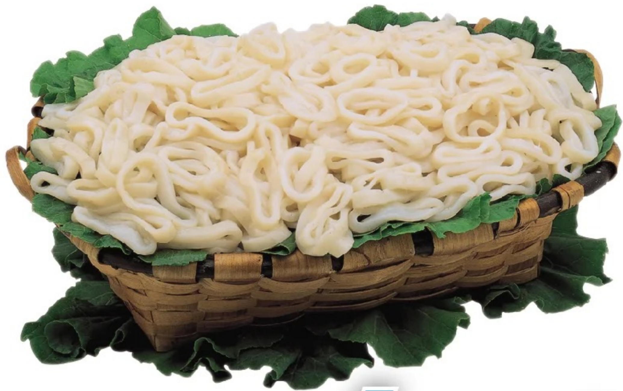
ANILLAS DE CALAMAR el kilo