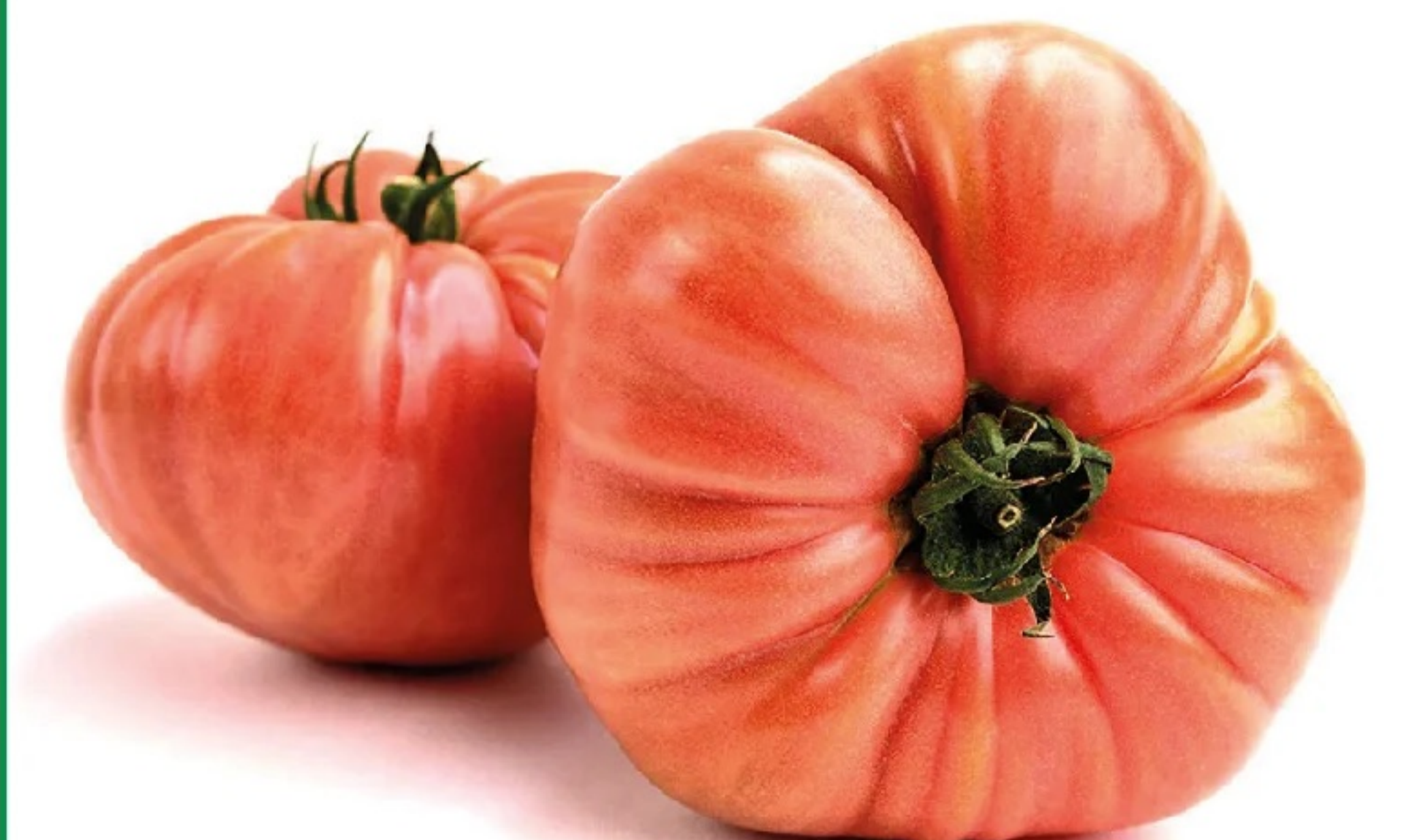
TOMATE ROSA ENSALADA el kilo