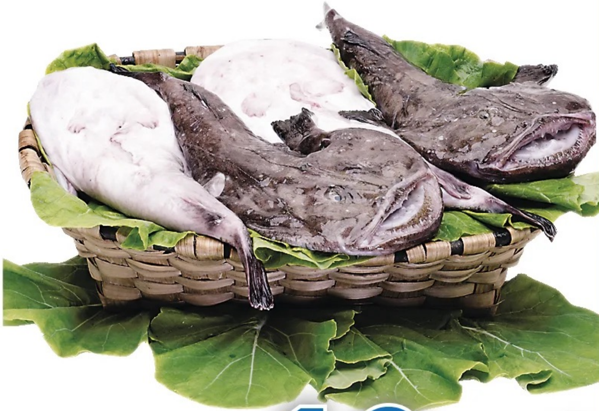
PIXÍN piezas de 1 a 3 kgs. el kilo