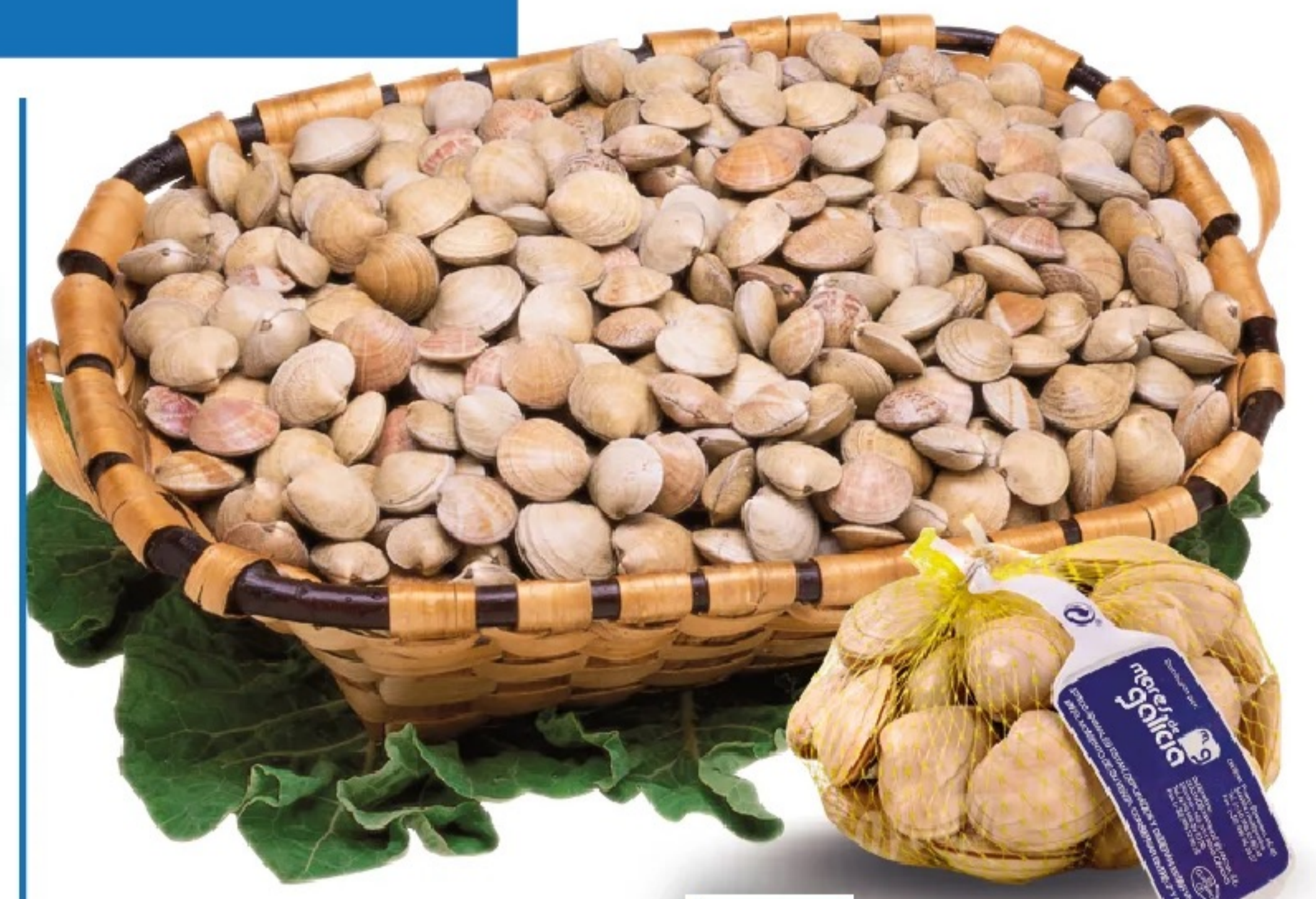
ALMEJA BLANCA bolsa de 500 g.