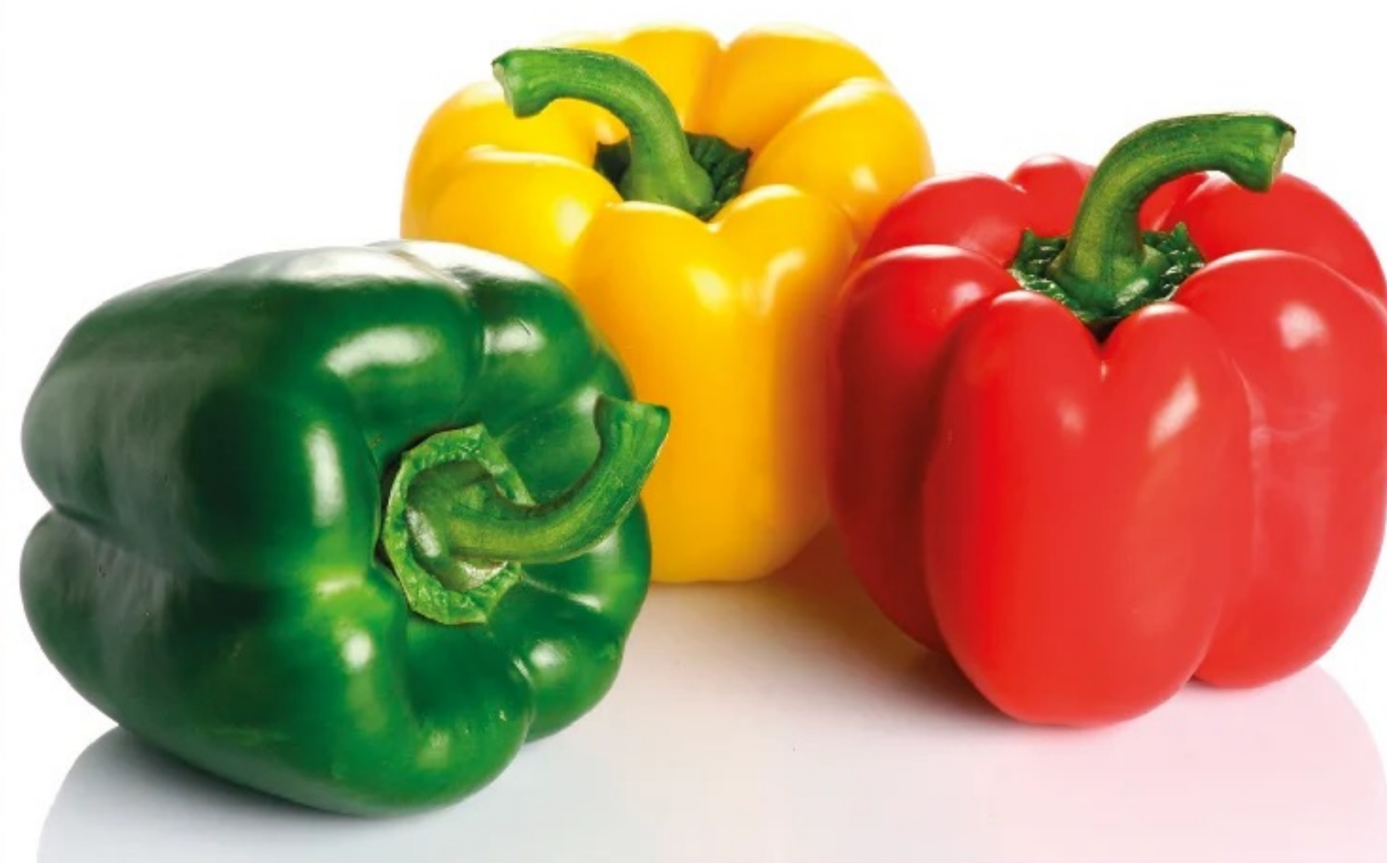
PIMIENTO TRICOLOR Pack