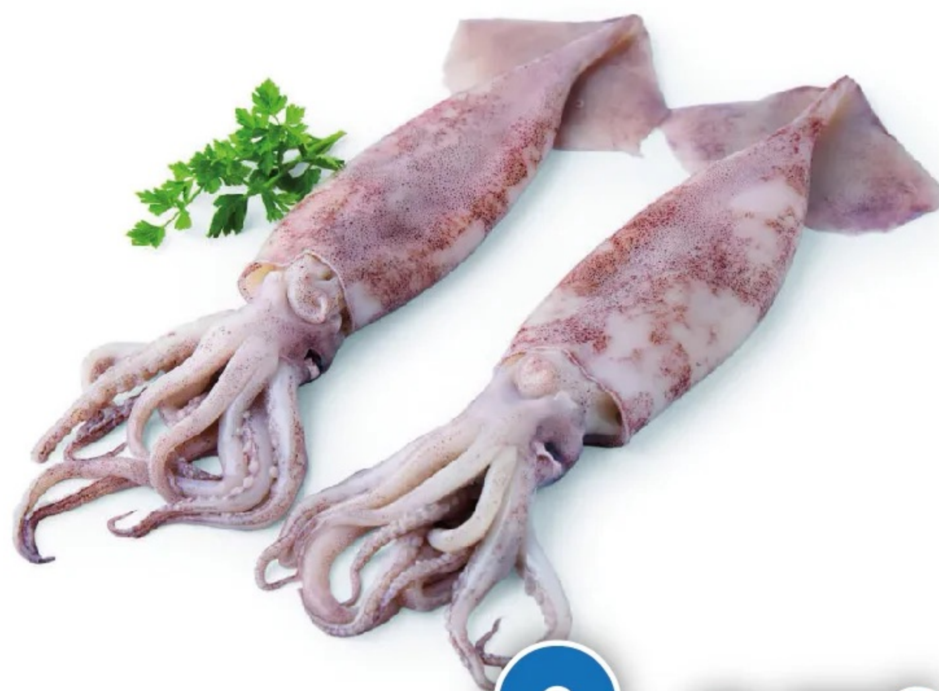
POTARRO FRESCO DE RULA el kilo