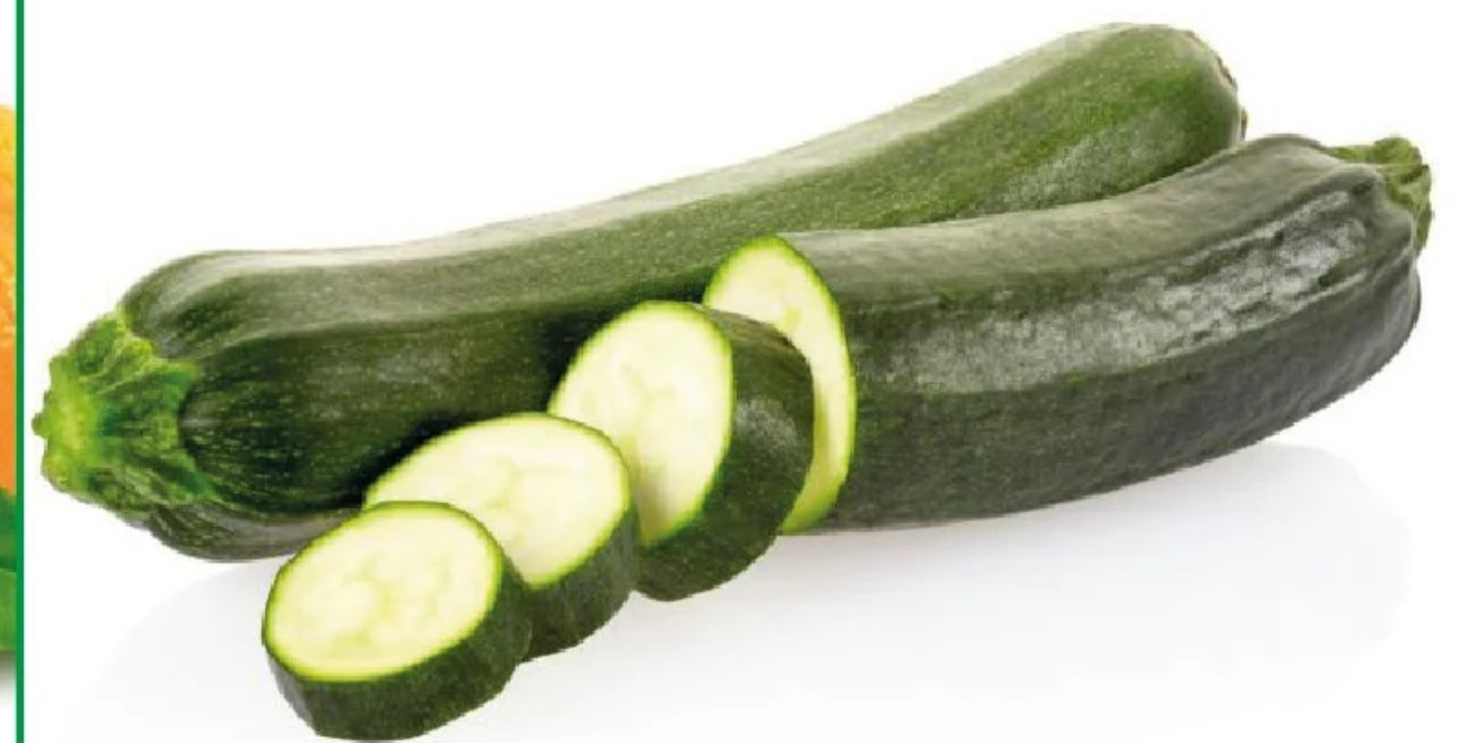
CALABACÍN el kilo