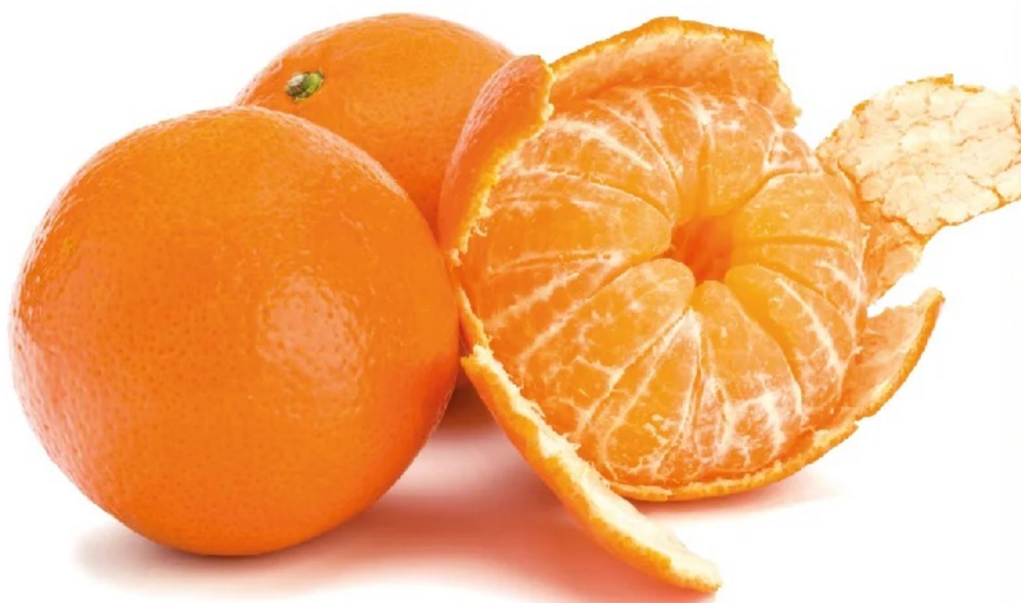
MANDARINA ORRY el kilo