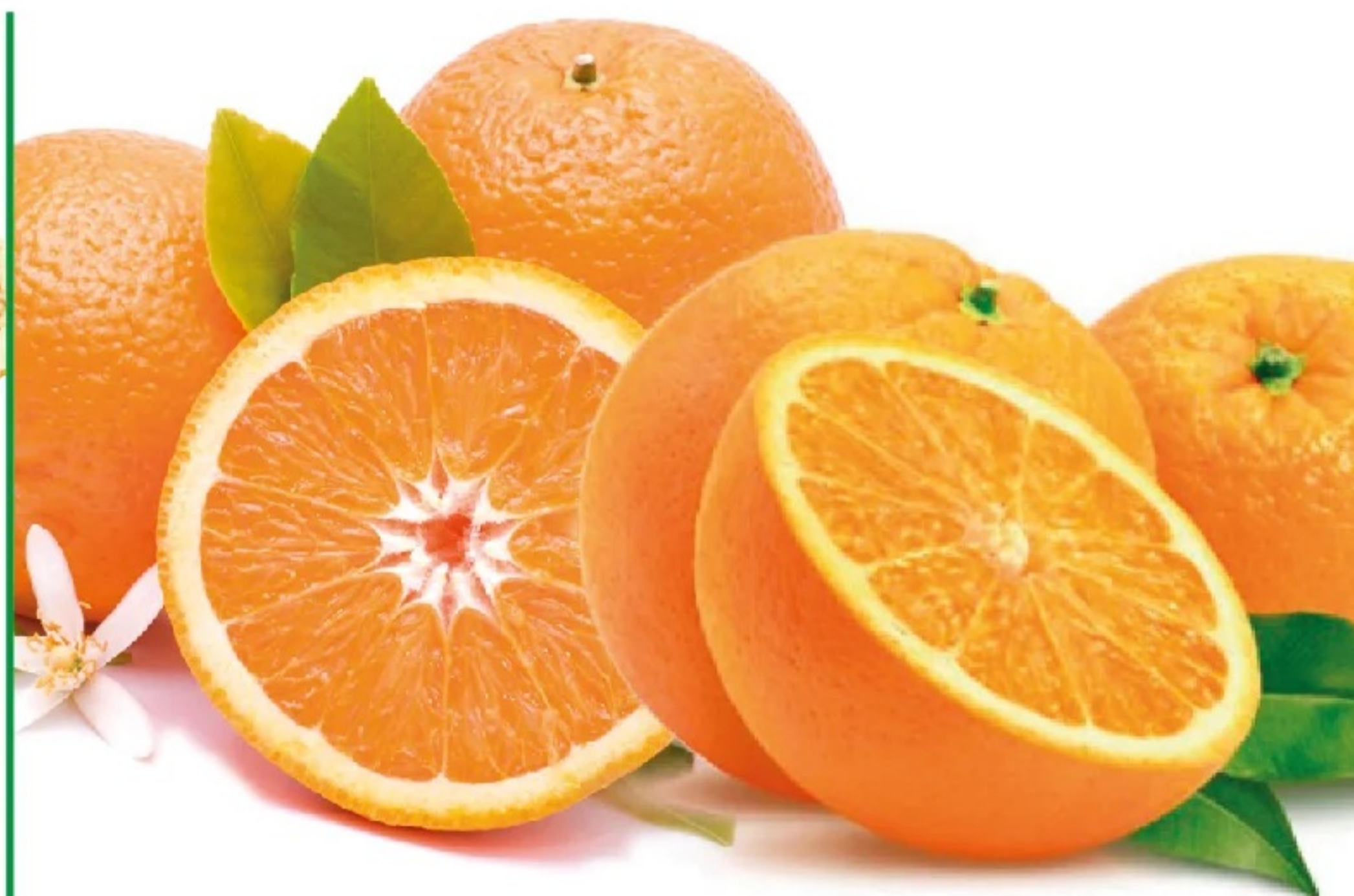
NARANJA MESA el kilo