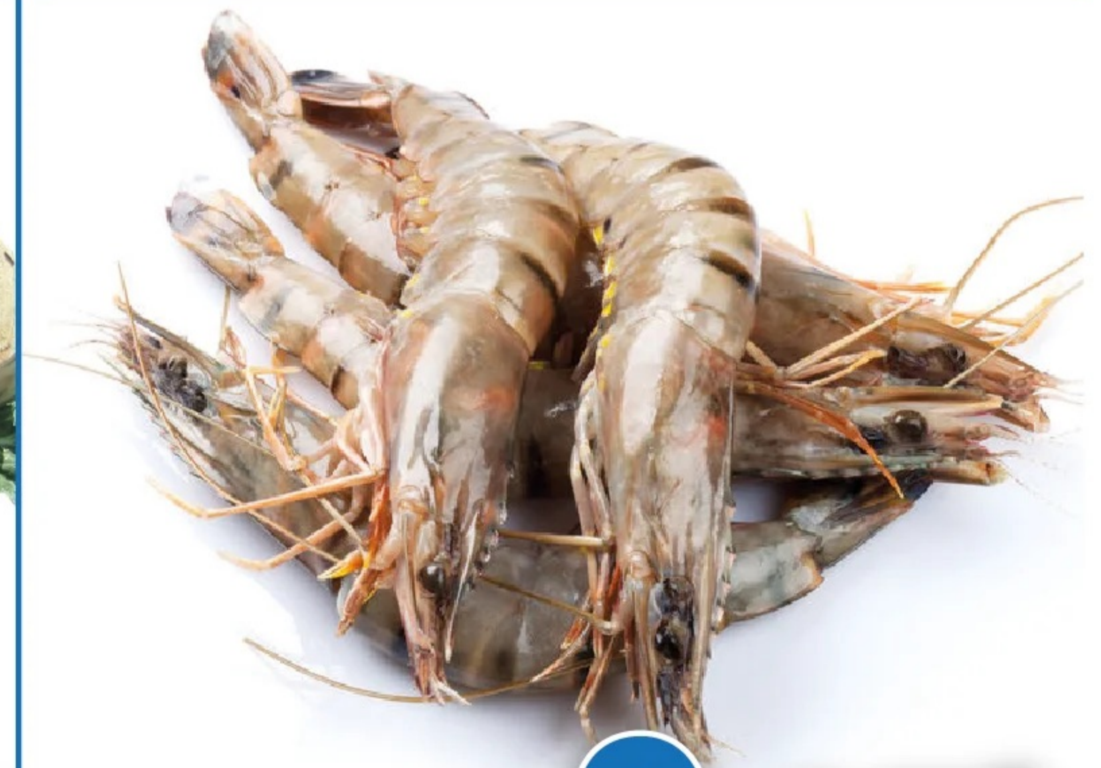
LANGOSTINO CRUDO el kilo