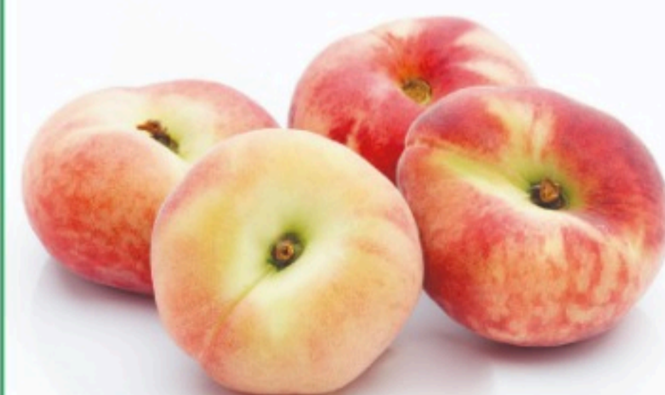
PARAGUAYO el kilo