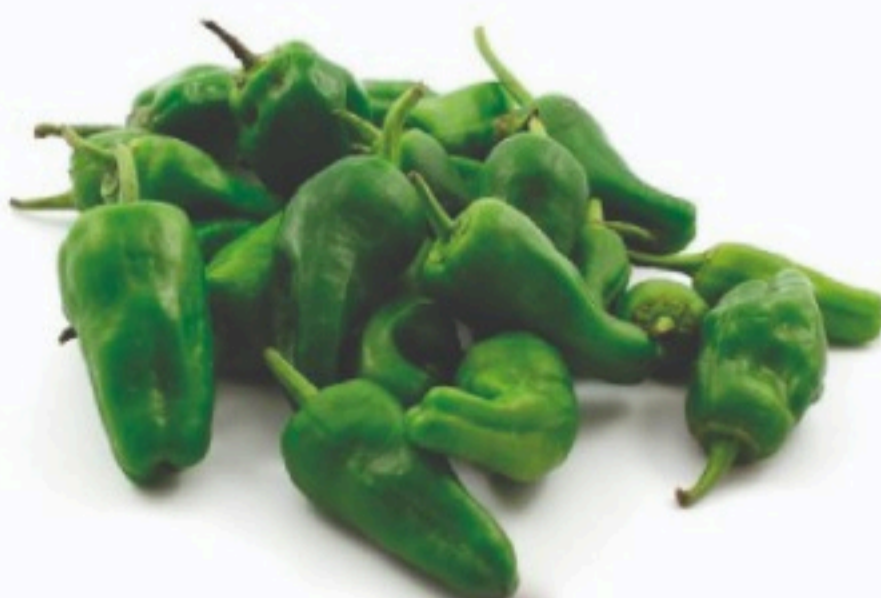
PIMIENTO TIPO PADRÓN Tarrina 250 g