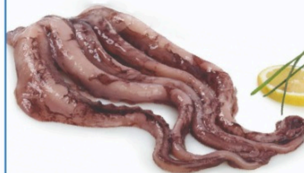
REJOS DE POTA el kilo