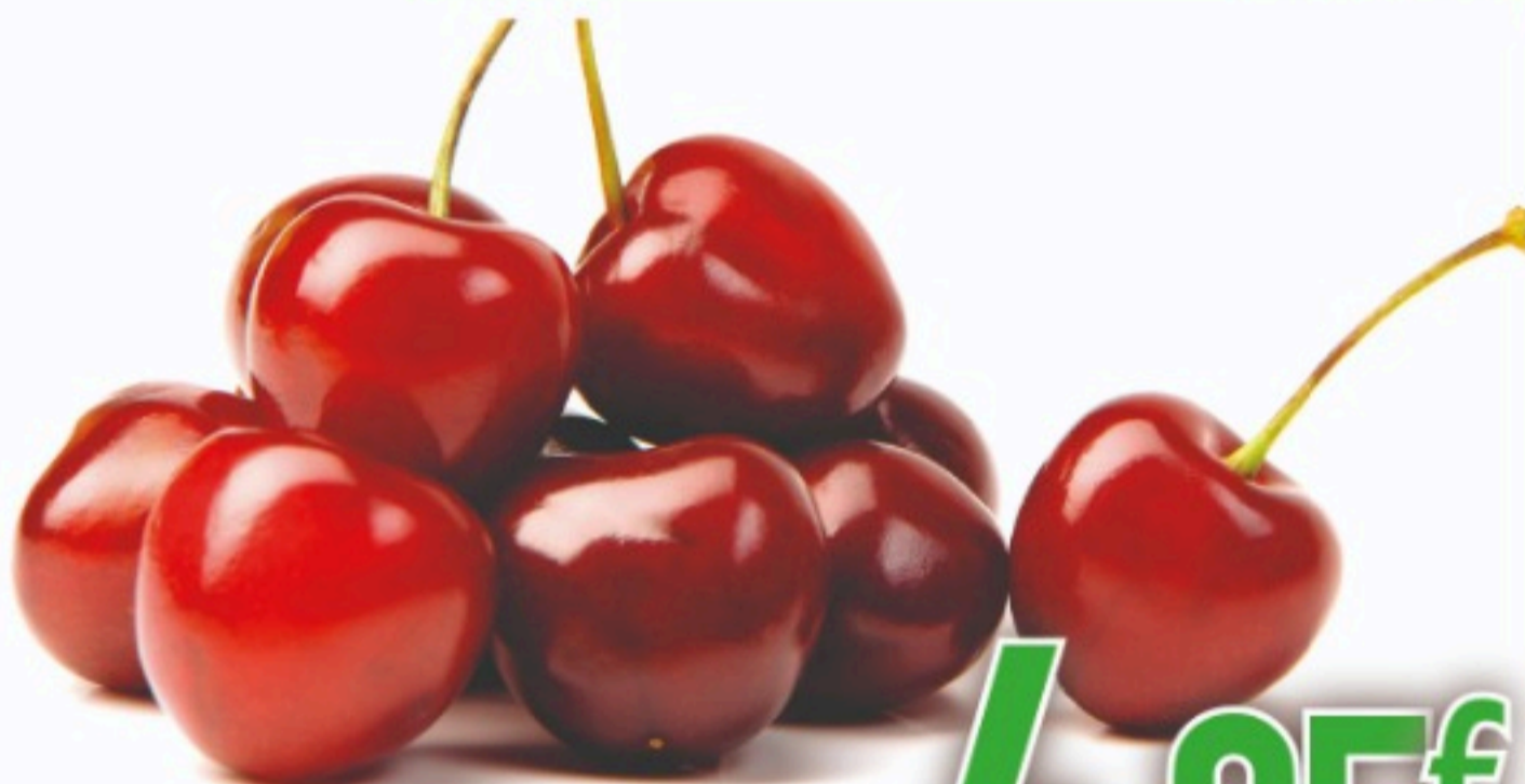
CEREZA GORDA el kilo