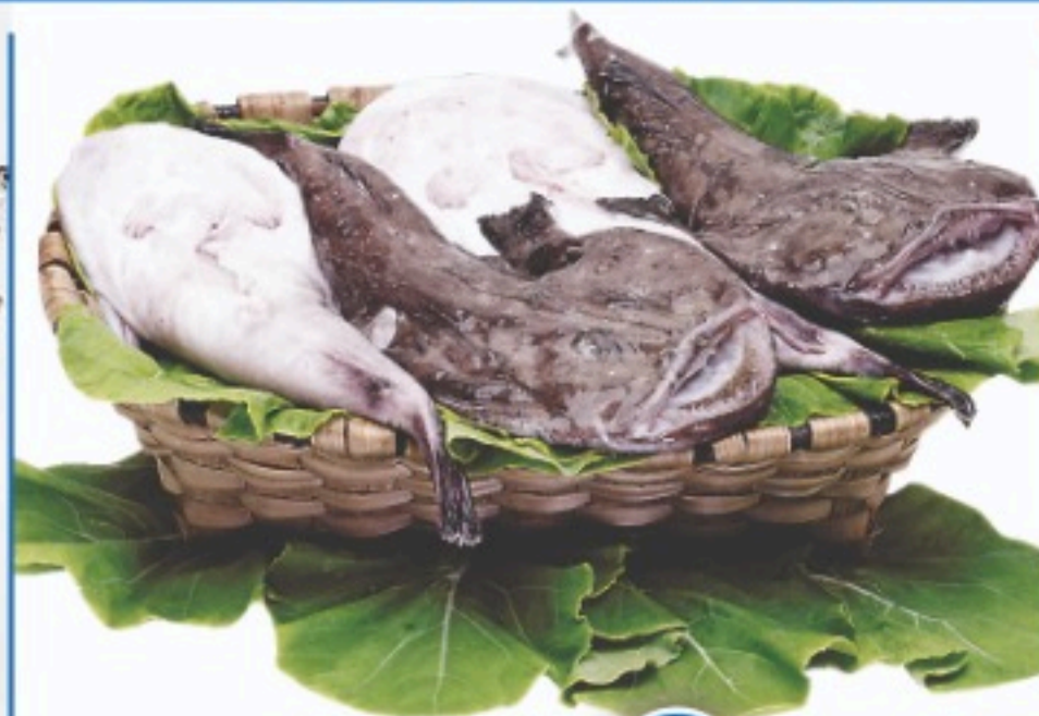
PIXÍN piezas de 1 a 3 kgs. el kilo