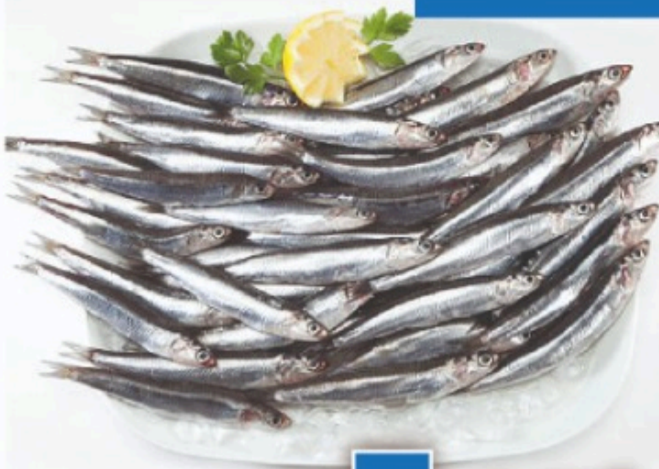
BOCARTE DEL CANTÁBRICO el kilo