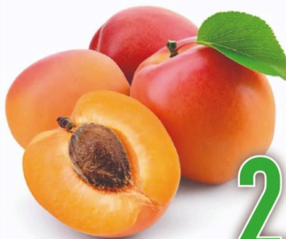
ALBARICOQUE el kilo