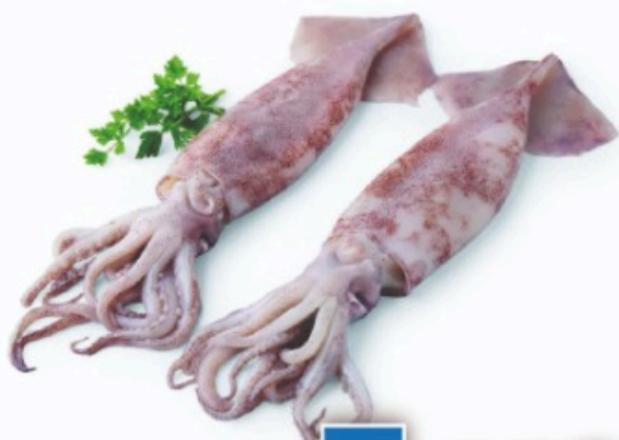
POTARRO GORDO FRESCO DE RULA el kilo