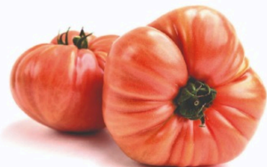
TOMATE ROSA ENSALADA el kilo