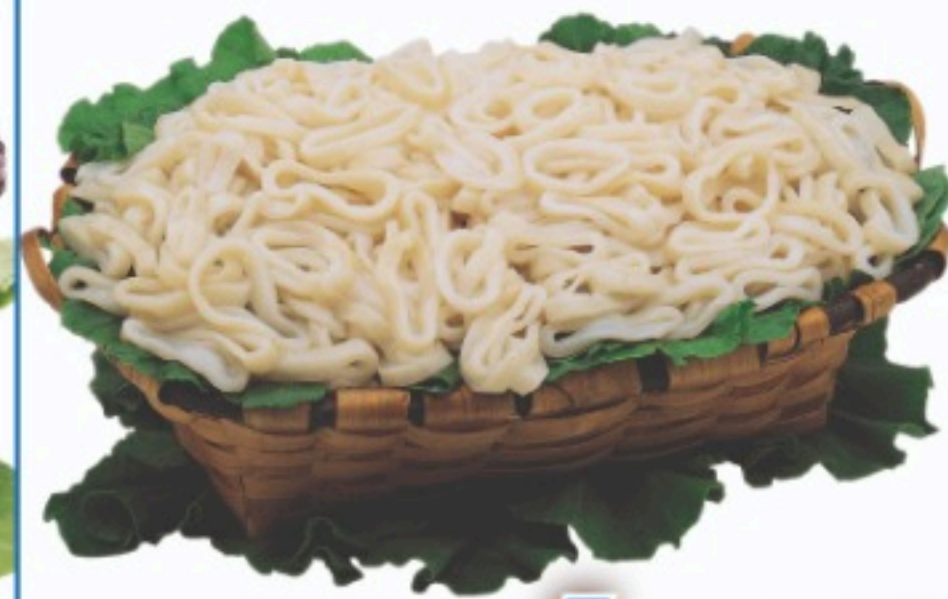
ANILLAS DE CALAMAR el kilo